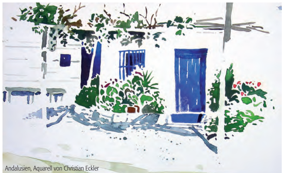
Andalusien, Aquarell von Christian Eckler

vhs-Zentrum, Landshuter Str. 20-22 Geöffnet zu den Büro- und Kurszeiten der vhs-Geschäftsstelle sowie nach telefonischer Vereinbarung Vernissage: Donnerstag, 14.06.12, 19.00 Uhr